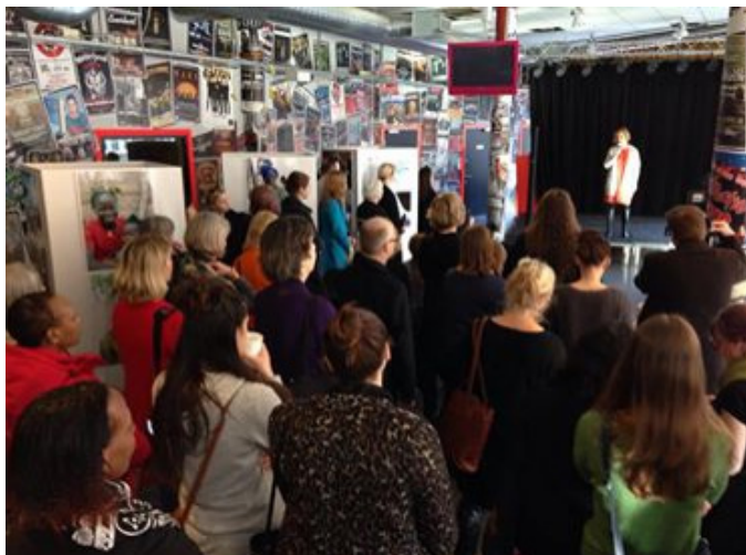
Fryshuset 8 mars.